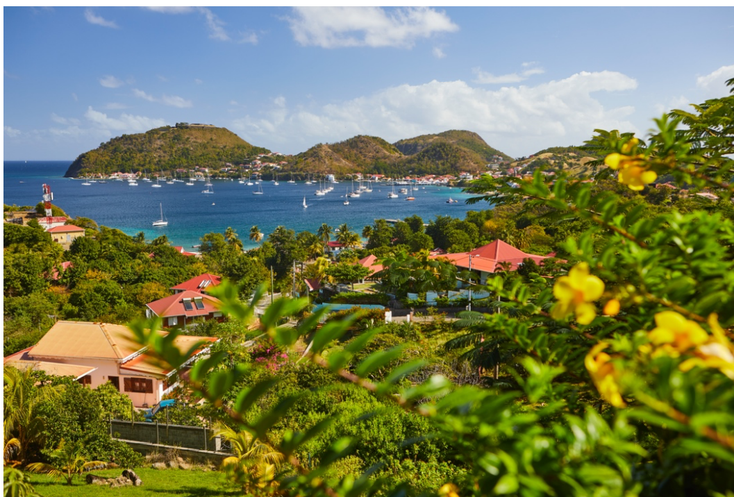
Guadeloupe – Crédit Photo : CTIG / B. Dequenne

En amont du salon, le CTIG donne rendez-vous aux professionnels du tourisme pour une conférence de presse suivi d'un workshop, le 19 septembre à 16h00 à L'Atelier du France (12 port de Grenelle, Paris 15 ème ).