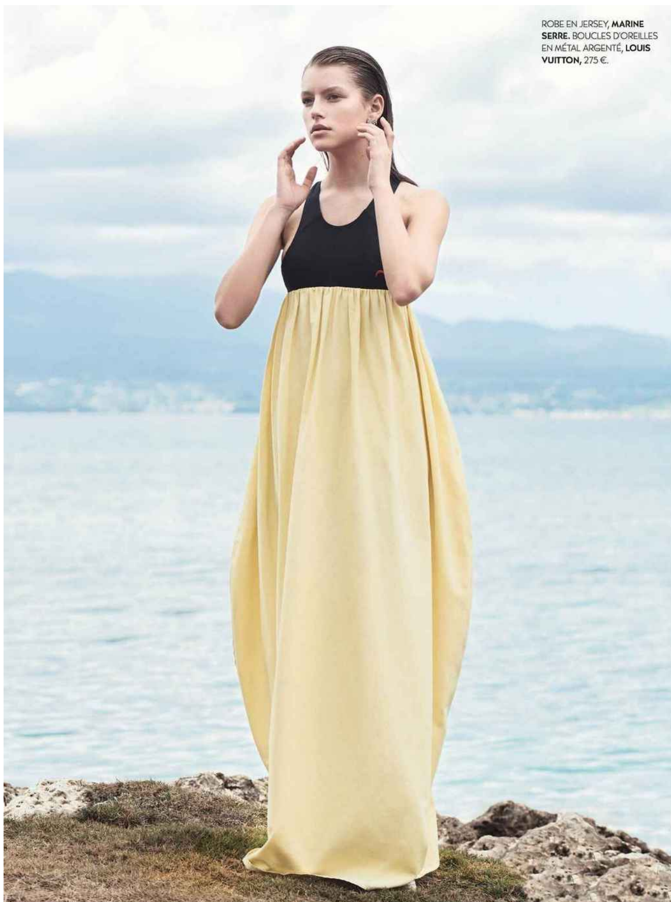
ROBE EN JERSEY, MARINE SERRE. BOUCLES D'OREILLES EN MÉTAL ARGENTÉ, LOUIS VUITTON, 275 €.