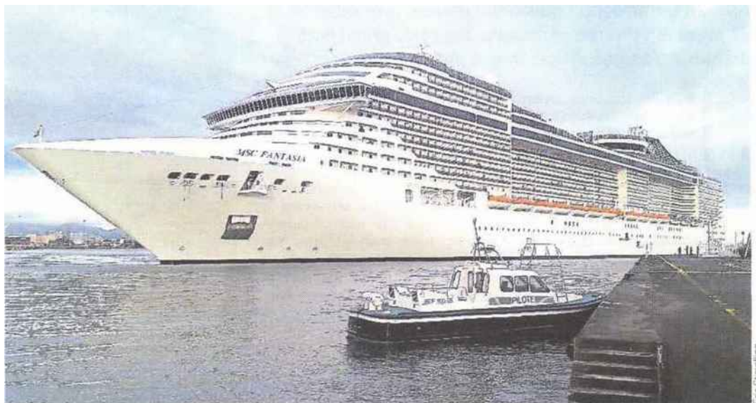
Le « MSC Fantasia » a effectué 20 escales en port base à Pointe-à-Pitre.