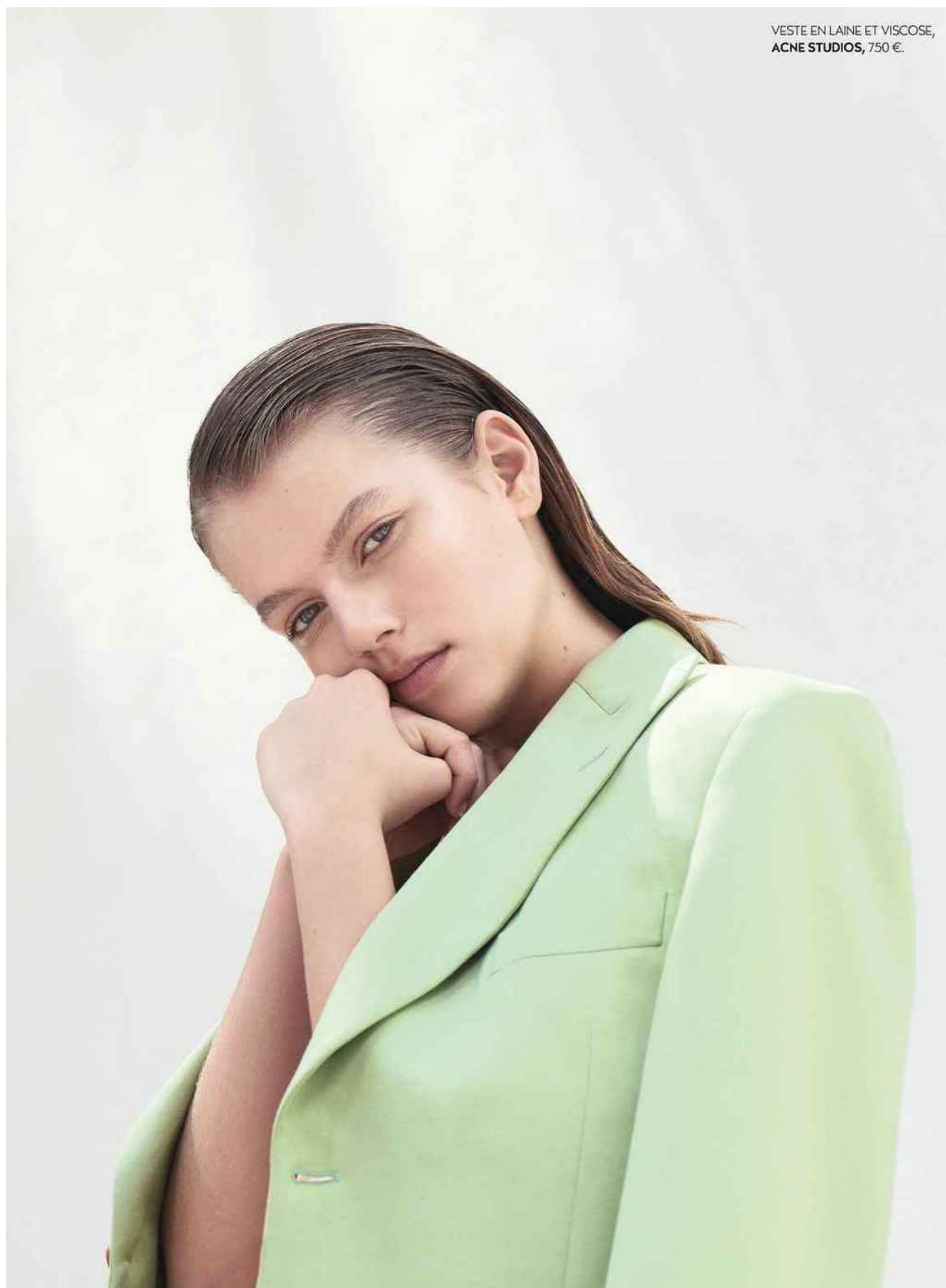
VESTE EN LAINE ET VISCOSE, ACNE STUDIOS, 750 €.