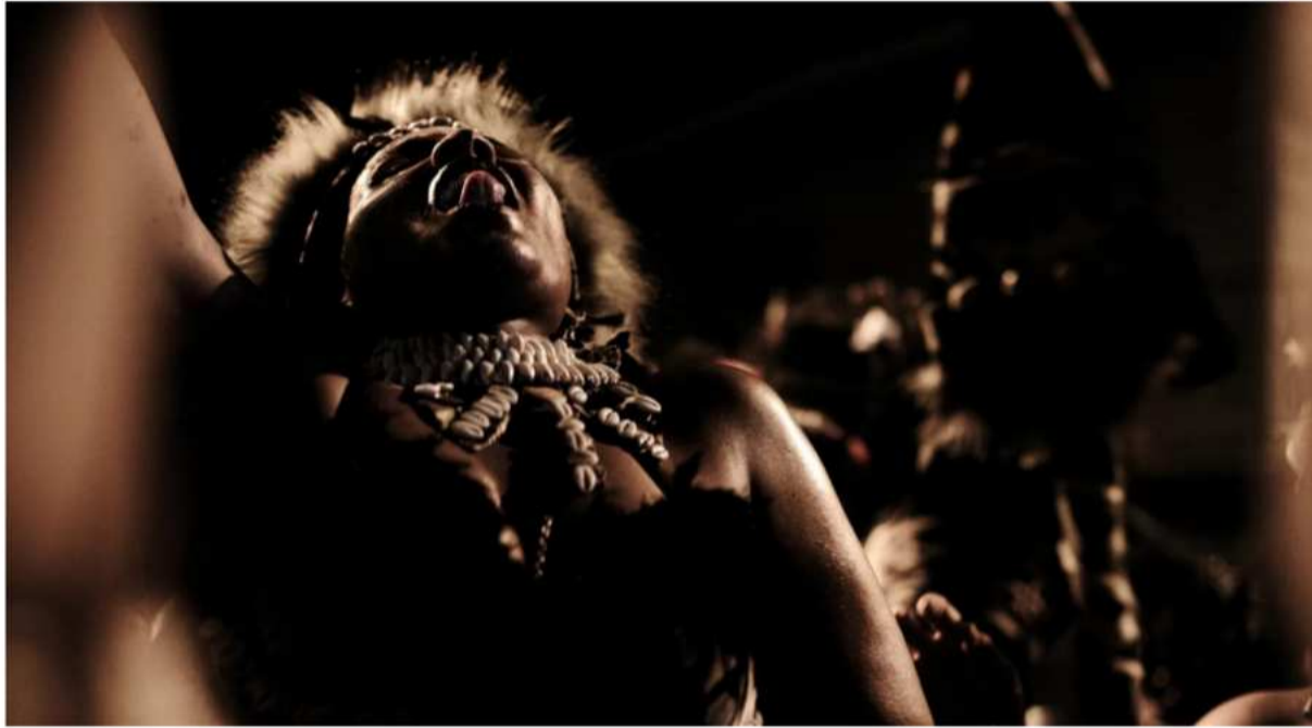
Cédrick-Isham Calvados, série "An mitan an nou" (En nous), photographie

Les amateurs d'Art ont rendez-vous avec la nouvelle scène artistique guadeloupéenne à Paris et à Pointe-à-Pitre, dès le 1er juin 2024.