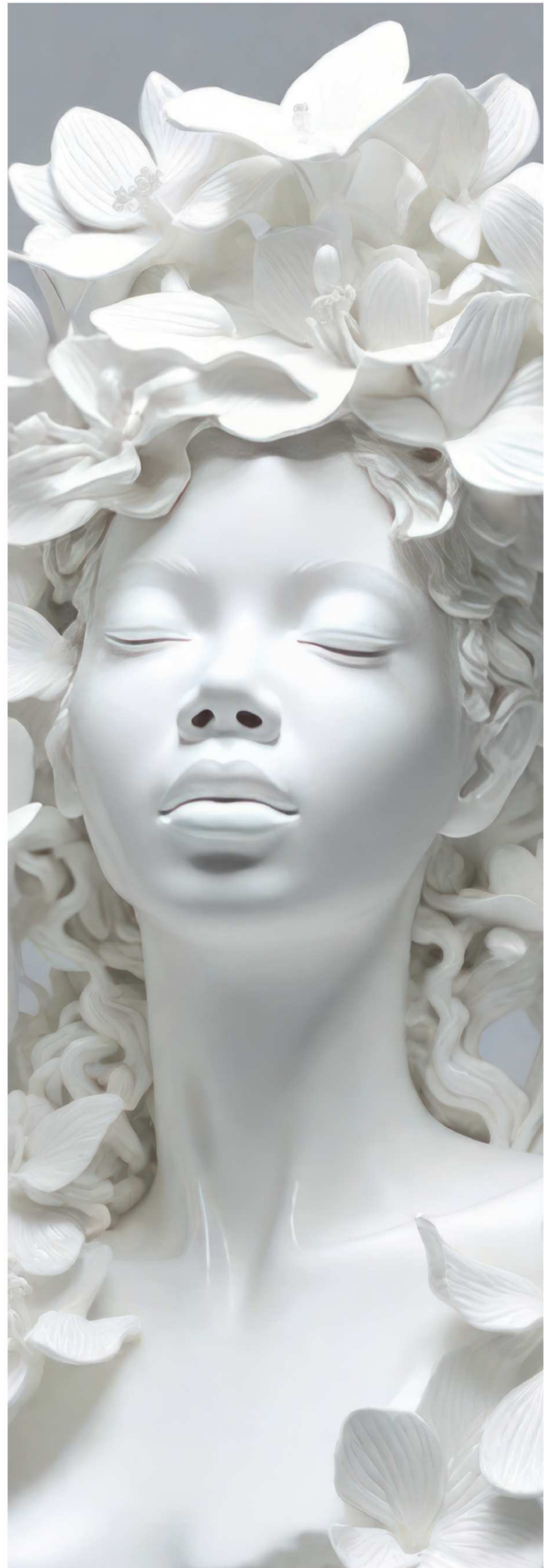
Pock, "Nèg an Poslen", images générées par intelligence artificielle

Les œuvres de Mixi , les images générées par l'IA de Pock et les vidéos de Minia Biabiany nous renvoient vers une notion de liberté, de fierté et font entrevoir une possible rémission.