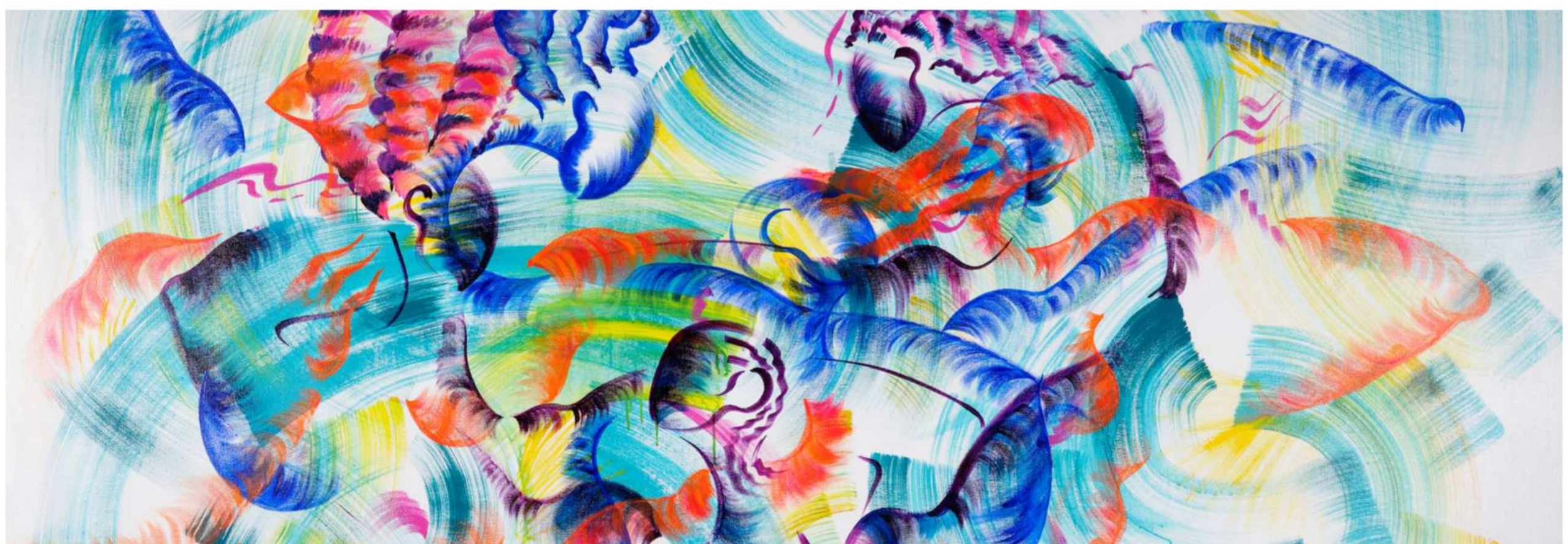
Daena Ladéesse, "Exodus of the descendants" (détail), acrylique sur toile

C'est à cette occasion que les Îles de Guadeloupe sont invitées à venir raconter leur culture au reste du monde. A quelques encablures du Palais Garnier, des Grands Magasins et des Grands Boulevards, près de 200m 2 d'expositions répartis sur 5 espaces seront dédiés aux œuvres.