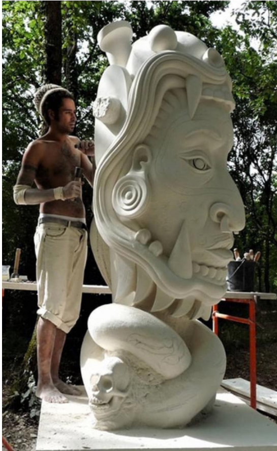
Sculpture monumentale de Thomas Petit