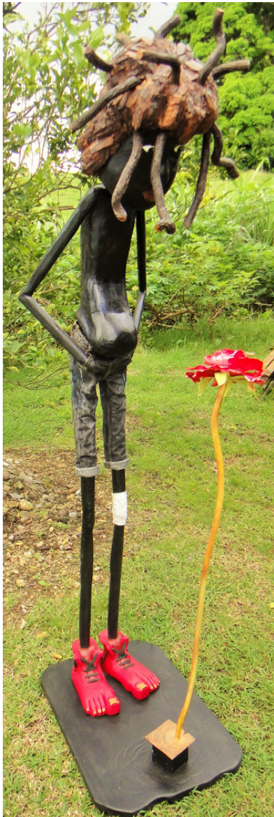
"Jeune homme à la rose" - Jérôme Jean-Charles