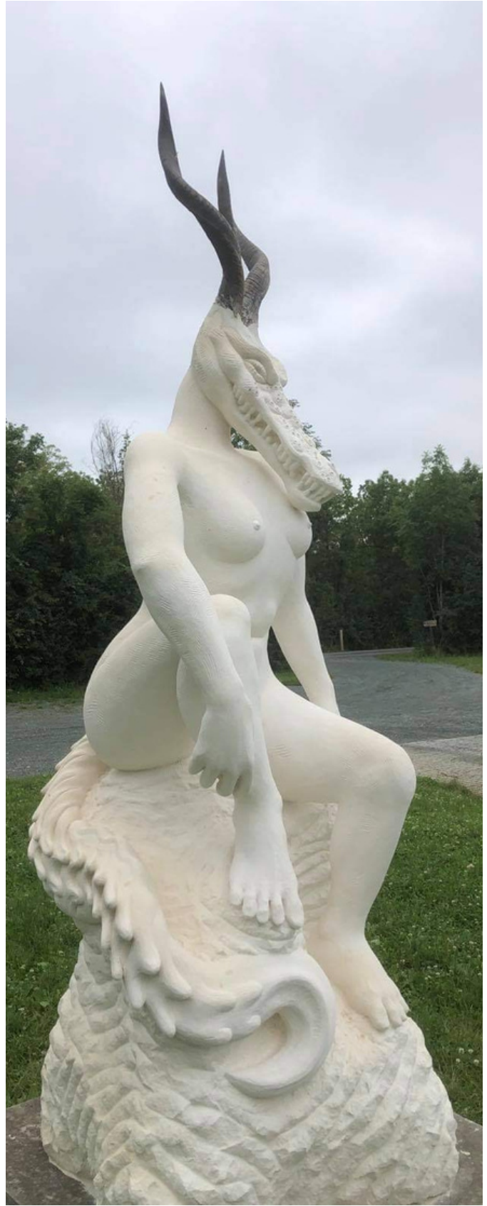
Sculpture monumentale de Thomas Petit