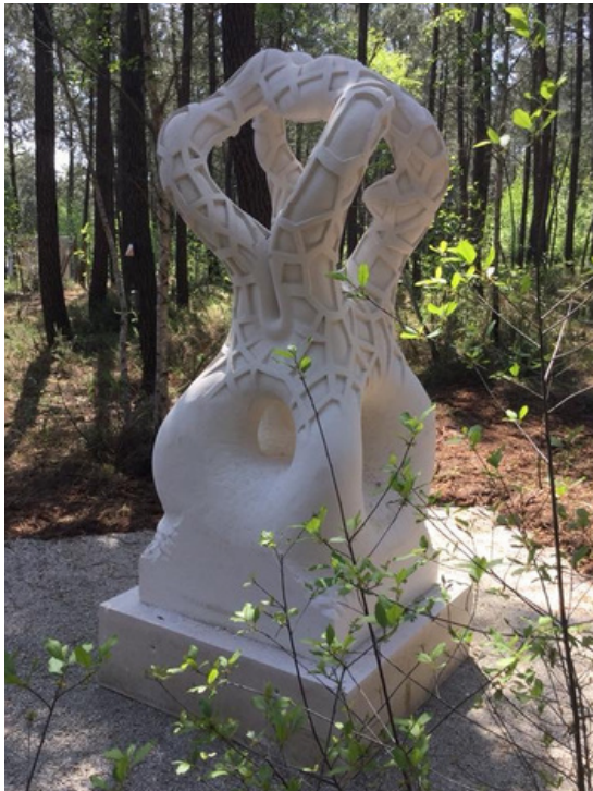
Sculpture monumentale de Thomas Petit