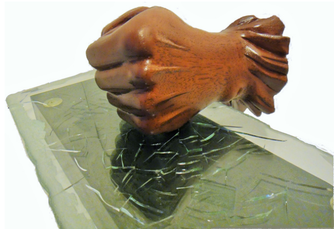
"L'indigné" - Jérôme Jean-Charles